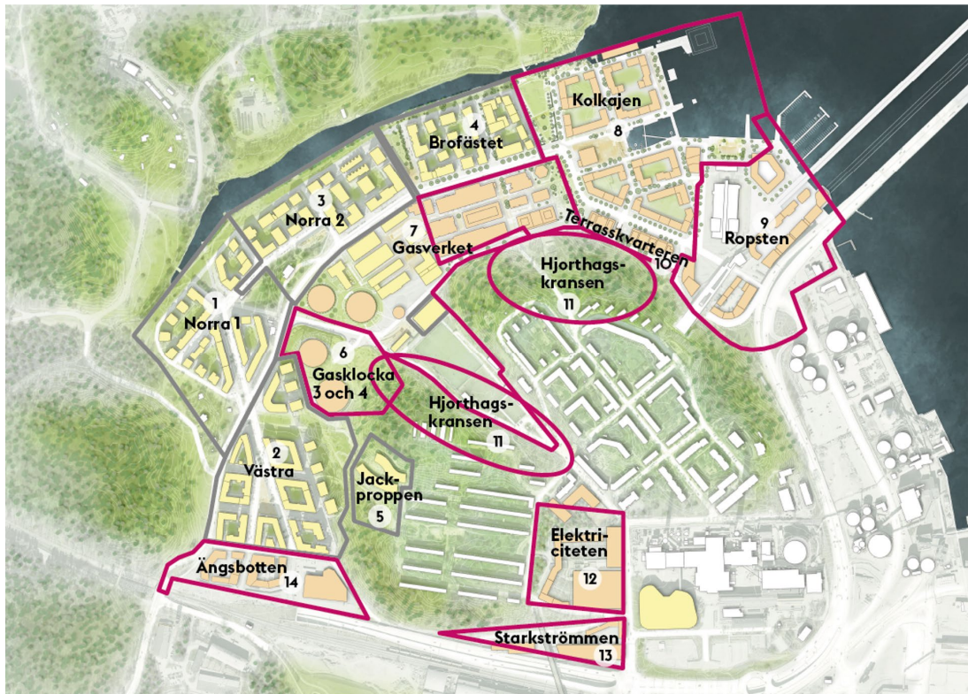
Kartbild över avslutade och pågående projekt inom Hjorthagen, del av stadsutvecklingsprojektet Norra Djurgårdsstaden. Inringade områden är planerade och pågående projekt.